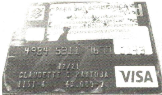
Figura 3 - NÚMERO DA CONTA