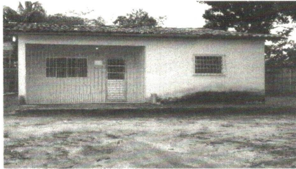
Figura 1 - REFERIDO IMÓVEL ALUGADO